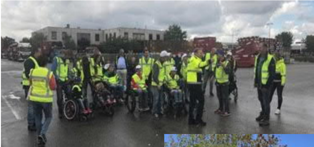
Wandeltocht met gehandicapte kinderen bij en gesponsord door Renewi