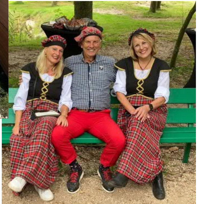
Kiwanis Goede Doelen Golftoernooi 2021