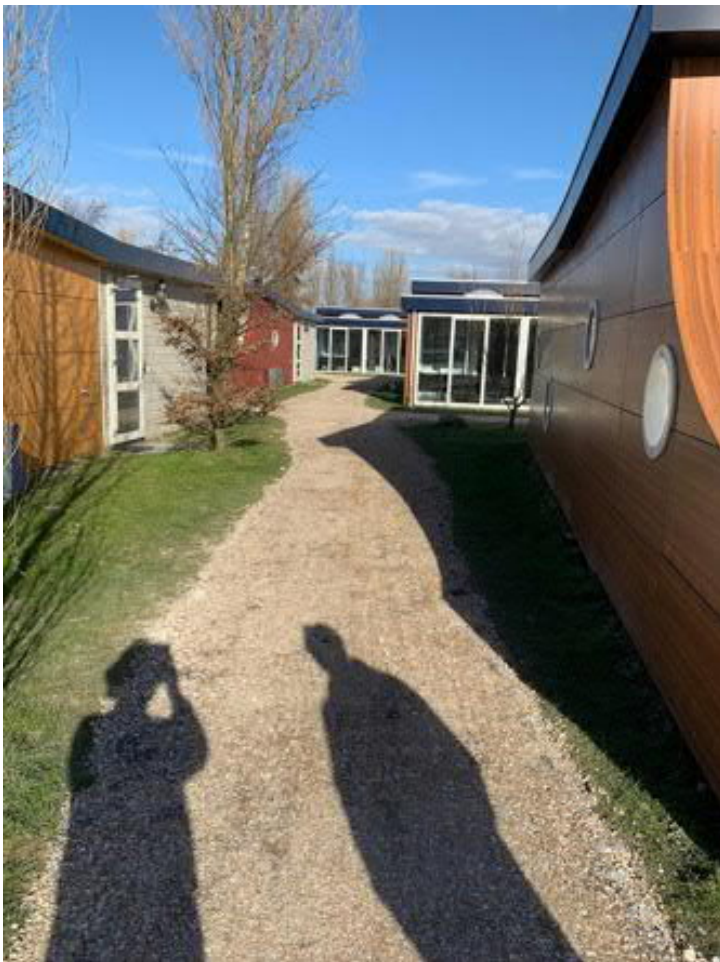
Toegangspad aanleggen voor Avavieren