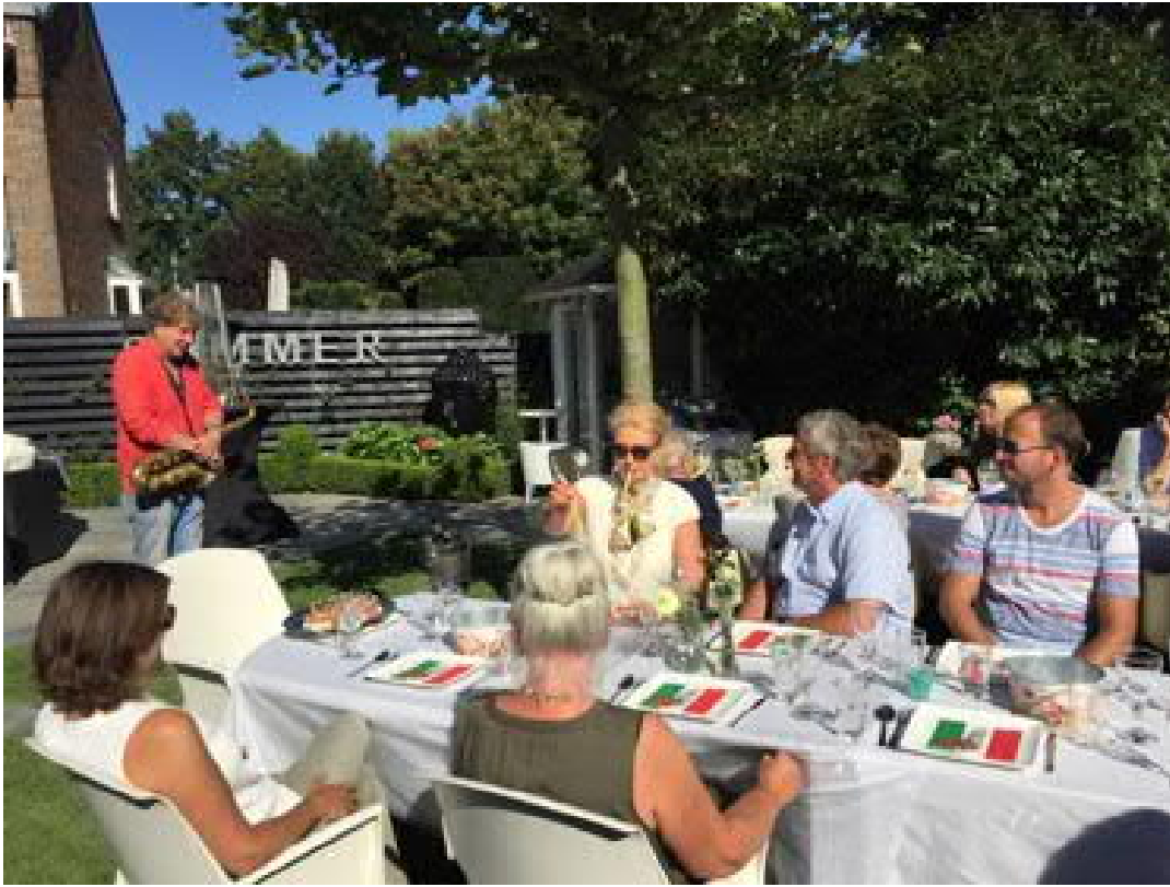
Kiwanis Italian Summerparty 2018