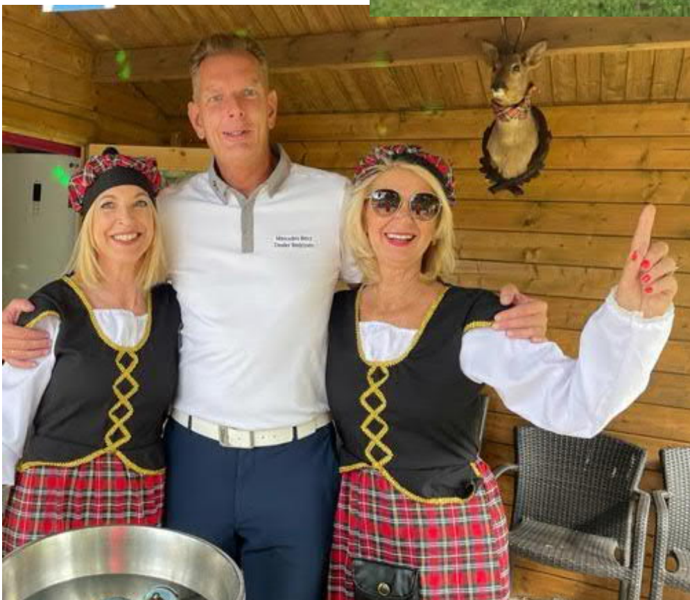
Het jaarlijkse Kiwanis Westland Goede Doelen Golftoernooi, in 2021 al weer voor de zevende keer. De opbrengst is elk jaar meer dan € 10.000,- en gaat naar twee kindgerichte lokale goede doelen