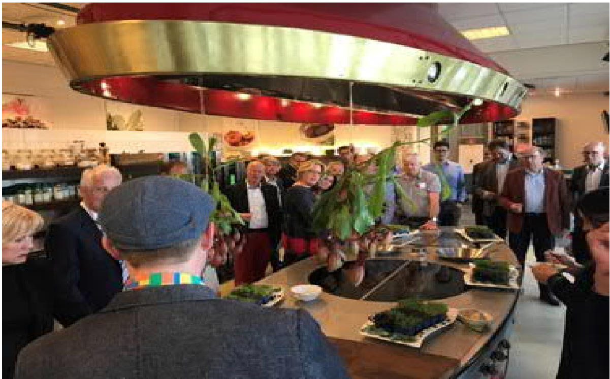
Bezoek aan Koppert-Cress